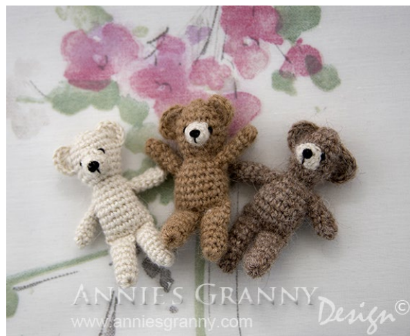
Three little bears crocheted with alpaca yarn.