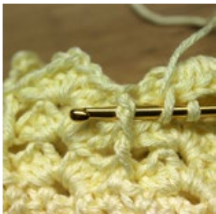
Varv 4 - Detalj som visar hur man virkar en reliefstolpe framifrån i föregående varvs reliefstolpe.