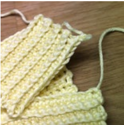
Sista varvet överst på bild och första varvet underst.

Vik resåren på mitten och börja virka ihop sidan. Dra maskan från den sist virkade fm igenom den första m på varv 1. Gör 1 sm igenom nästa m på varv 1 och samtidigt igenom nästa maskas yttre maskbåge från det sista varvet. Upprepa för alla maskorna = 13 sm totalt.