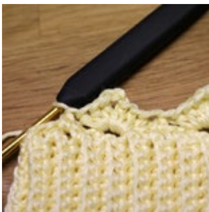
Varv 2 - Halvstolpgruppen (3 hst, 3 lm, 3 hst) följt av en halvstolpe i nästa lmb.