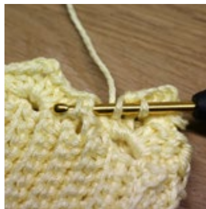
Varv 3 - Reliefstolpe framifrån i halvstolpen från föregående varv.