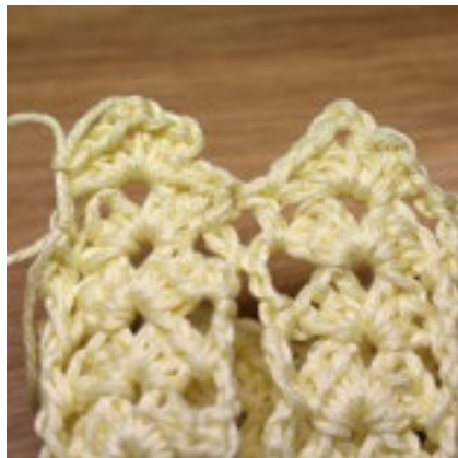
Varv 10 - Öppningen stängs.

Du får gratis använda mitt mönster, men jag skulle uppskatta om du ville lämna ett bidrag, litet eller stort, till min insamling till Barncancerfonden. Hjälp att göra skillnad!