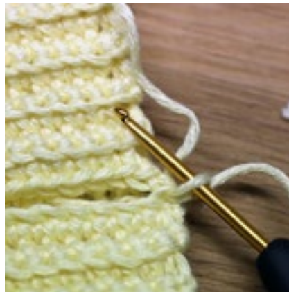
Garnet dras igenom 1:a m på varv 1.