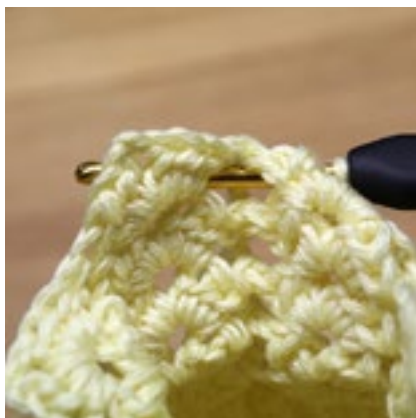
Varv 7 - Detalj som visar hur man virkar en reliefstolpe bakifrån i föregående varvs reliefstolpe.