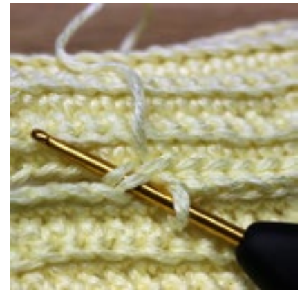
Varje m på varv 1 virkas ihop med motsvarande m bakre lmb på sista varvet.

Nu ska du fortsätta att virka runt. Byt ut virknålen till den större, storlek 3,5 mm.