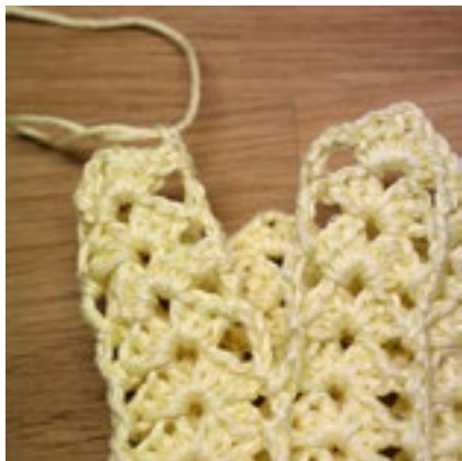
Varv 6-9 - Visar öppningen för tummen.

Klipp av garnet och dra det igenom den sista maskan. Fäst.